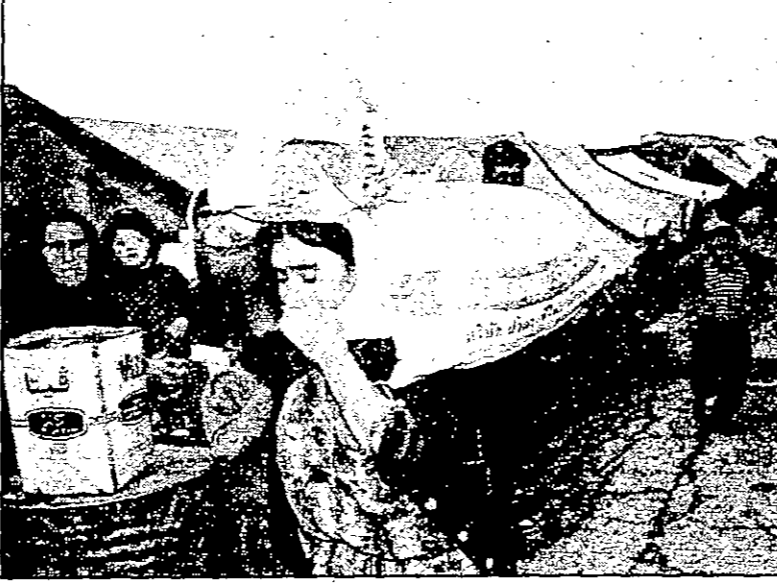
مساءة الاكرد العراقيين تثير مخاوف الساسة وحرس الحدود في الدول الأوروبية (صورة من الاريش)

ما اسوأ حظ الحكومة ايطالية: ان لم تكن تغلق ملف الهجرة الانسانية الجماعية الى اراضيها حيث قامت السلطات في نهاية العام بترحيل آلاف اللاجئين الذين دخلوا البلاد بطريقة غير قانونية.